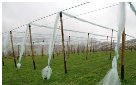
Abbildung 6: Breitenhof Parzelle 53 für Freilandversuche