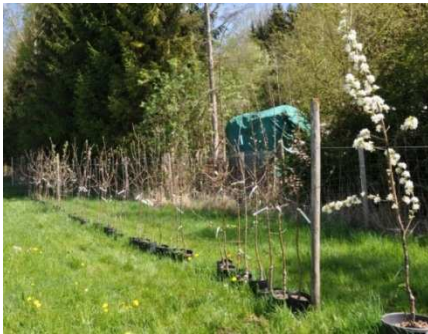
Abbildung 4: Topfbäume für Blütenanfälligkeitstest mit Frostschaden