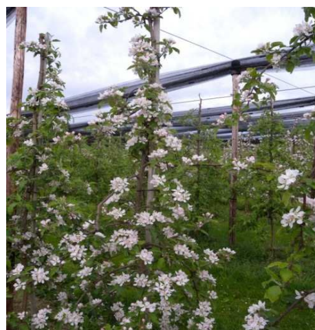
Abbildung 7: Entwicklungsstadium bei der ersten Behandlung am 30.4.2012

Weiter erfolgte am 17. Juli 2012 eine gemeinsame Beurteilung der Fruchtberostung bei Gala durch den Obstbauern, einen Berater der Kantonalen Fachstelle für Obstbau und die Agroscope. Es konnte im Verfahren mit dem Mittel LMA keine Mehrberostung der Früchte festgestellt werden. Die im 2012 festgestellte Wirksamkeit von LMA soll 2013 in weiteren Feldversuchen bestätigt, respektive absichert werden.