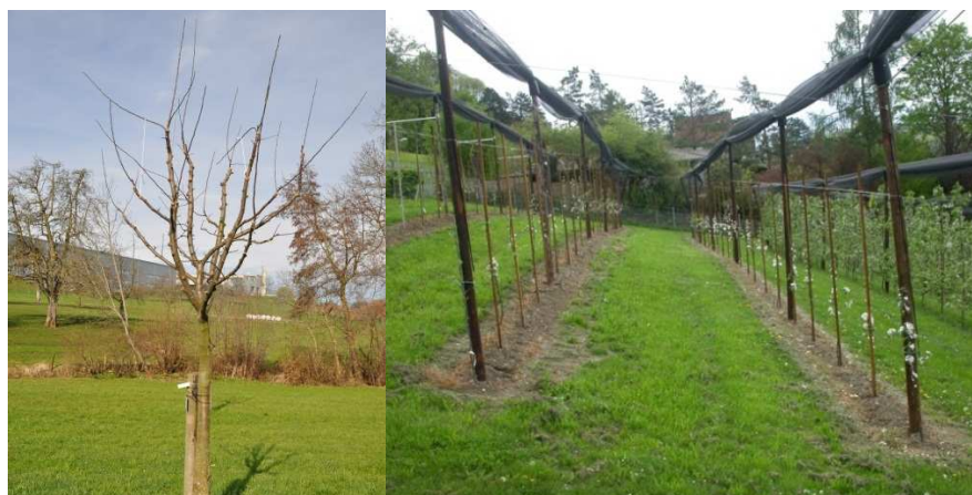
Abbildung 5: Neuveredlung Hochstammanlage Alois Schilliger in Flawil (links) und Versuchsparzelle Wülflingen

Für 2013 sind Erhebungen betreffend Wuchs- und Produktionseigenschaften, Toleranz gegenüber Schädlingen und Krankheiten sowie Frucht- und Saftqualität vorgesehen.