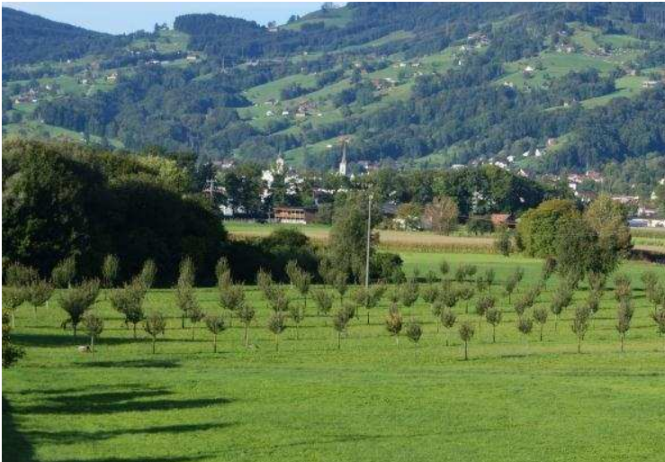
Abbildung 8: Interreg IV Anlage Brocker in Marbach

Dazu wurden zehn Zweige von 2-jährigen Apfelbäumen (Gravensteiner), mit Feuerbrandbefall in 2011, eingehüllt. Als die Blüten das Ballonstadium erreicht hatten, wurden die Zweige geschnitten und mit Umhüllung weitere drei Tage im Labor der Agroscope ACW kultiviert. Anschliessend wurden pro Ast 20 Blüten entfernt. Im Plattentest konnten von den untersuchten Apfelblüten keine Ea-Kolonien isoliert werden. Zum Nachweis von Ea in den Blüten wurde zusätzlich PCR durchgeführt, jedoch konnten auch damit keine Erwinia amylovora nachgewiesen werden.