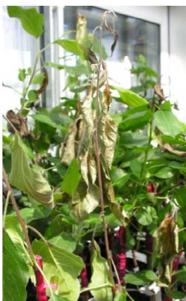
Abbildung 1: Triebtestungen 2012 Im Biosicherheitsgewächshaus

Im Frühling 2012 konnten 26 Apfel- und 15 Birnensorten auf ihre Triebanfälligkeit geprüft werden. Die Sortenauswahl basierte auf den Triebanfälligkeitstests der Vorjahre, den Verarbeitungsversuchen, auf Hinweisen aus der Praxis und Kontakten mit verschiedenen internationalen Züchtungsinstituten und Versuchsstationen, sowie auf Literaturangaben. Pro Sorte wurden 12 Bäume auf M9 T337, beziehungsweise BA29 veredelt.